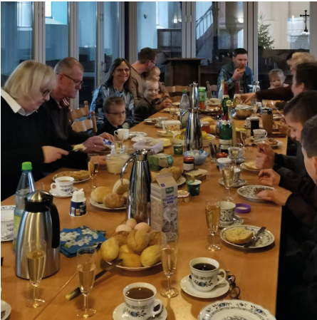
Traditionelles Weihnachtsfrühstück am 2. Weihnachtstag in der Horstdorfer Winterkirche und anschließendem Gottesdienst