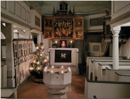
Vor Beginn der Christvesper in Goltewitz