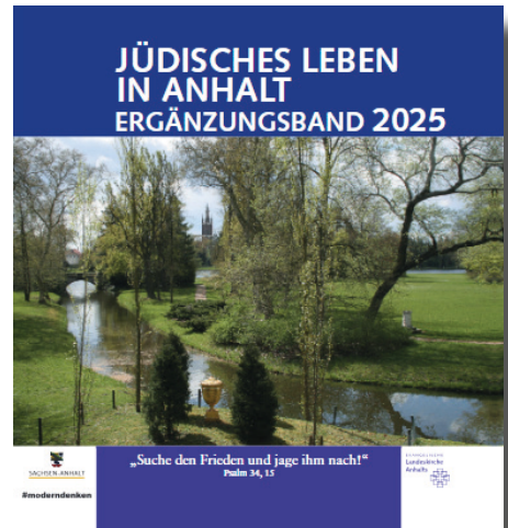
Vorderseite des vorgestellten Ergänzungsbandes

Dazu wird ein Buch vorgestellt, das vom aktiven Gedenken in den Ortschaften vom Harz bis Zerbst berichtet.