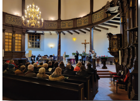
Adventsmusik in der Stadtkirche Oranienbaum am 07.12.2025