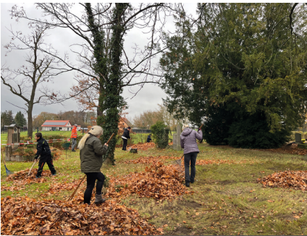
Hobetag auf dem Friedhof in Horstdorf

Ein herzliches Dankeschön für Ihre Unterstützung! GKR Horstdorf