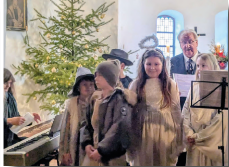
Heiligabend in Sollnitz

Am Heiligen Abend war unsere Dorfkirche in Sollnitz gut besucht. Alle wollten gern das Krippenspiel sehen, welches unsere Kinder in schönen Kostümen vorgespielt haben.