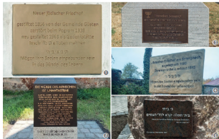
Rückseite des vorgestellten Ergänzungsbandes der Grabsteine in der Gedenkstätte am Jüdischen Friedhof in Wörlitz.

Besonders hervorgehoben wird die Wohltäterin von Anhalt: Julie von Cohn-Oppenheim (1839-1903), deren Familie aus Wörlitz stammt und die Einweihung der Dessauer „Weill-Synagoge“ am 22. Oktober 2023.