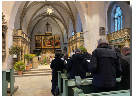
Trauerfeier für Gerhard Glaubig in der Stadtkirche Wittenberg • Bild: Bärbel Spieker

Nach einem schweren Jahr voller Probleme mit ihrem Haus und körperlichen Nöten, hat Gott Gerhard Glaubig am Vorabend des 4. Advent, 3 Wochen vor seinem 96. Geburtstag, zu sich gerufen.