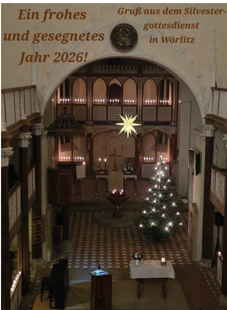
Silvester in Wörlitz • Bild: Susanne Simon