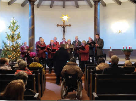
Weihnachtskonzert des Männerchors "Einigkeit" Dessau-Mildensee am 20.12.2025 in der Stadtkirche Oranienbaum

Am 20.12.2025 boten die Sänger des Männerchors "Einigkeit" Dessau-Mildensee den zahlreichen Besuchern ihr Können dar.