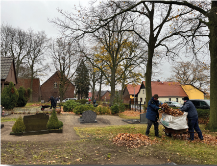
Hobetag auf dem Friedhof in Horstdorf

32 Helfende beteiligten sich am 15.11.2025 trotz nasskaltem Wetter am Hobetag auf dem Horstdorfer Friedhof.