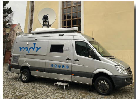
Der Übertragungswagen hinter der Stadtkirche